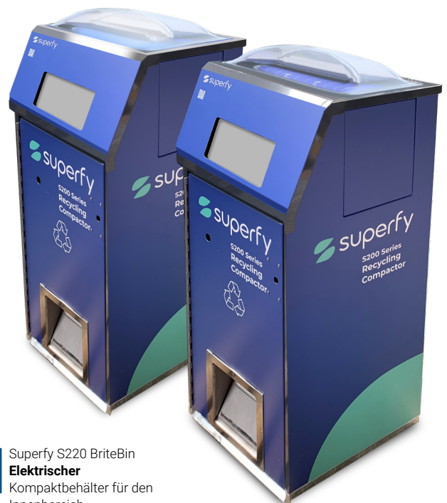
Superfy S220 BriteBin Elektrischer Kompaktbehälter für den Innenbereich

Für die Abfallöffnung gibt es zwei Möglichkeiten: einen Trichter, den wir alle 2–3 Monate reinigen. Alternativ gibt es eine Klappenöffnung, die häufiger verwendet wird, da sie nicht gereinigt werden muss. (Die Größe der Abfallöffnung kann individuell angepasst werden.)